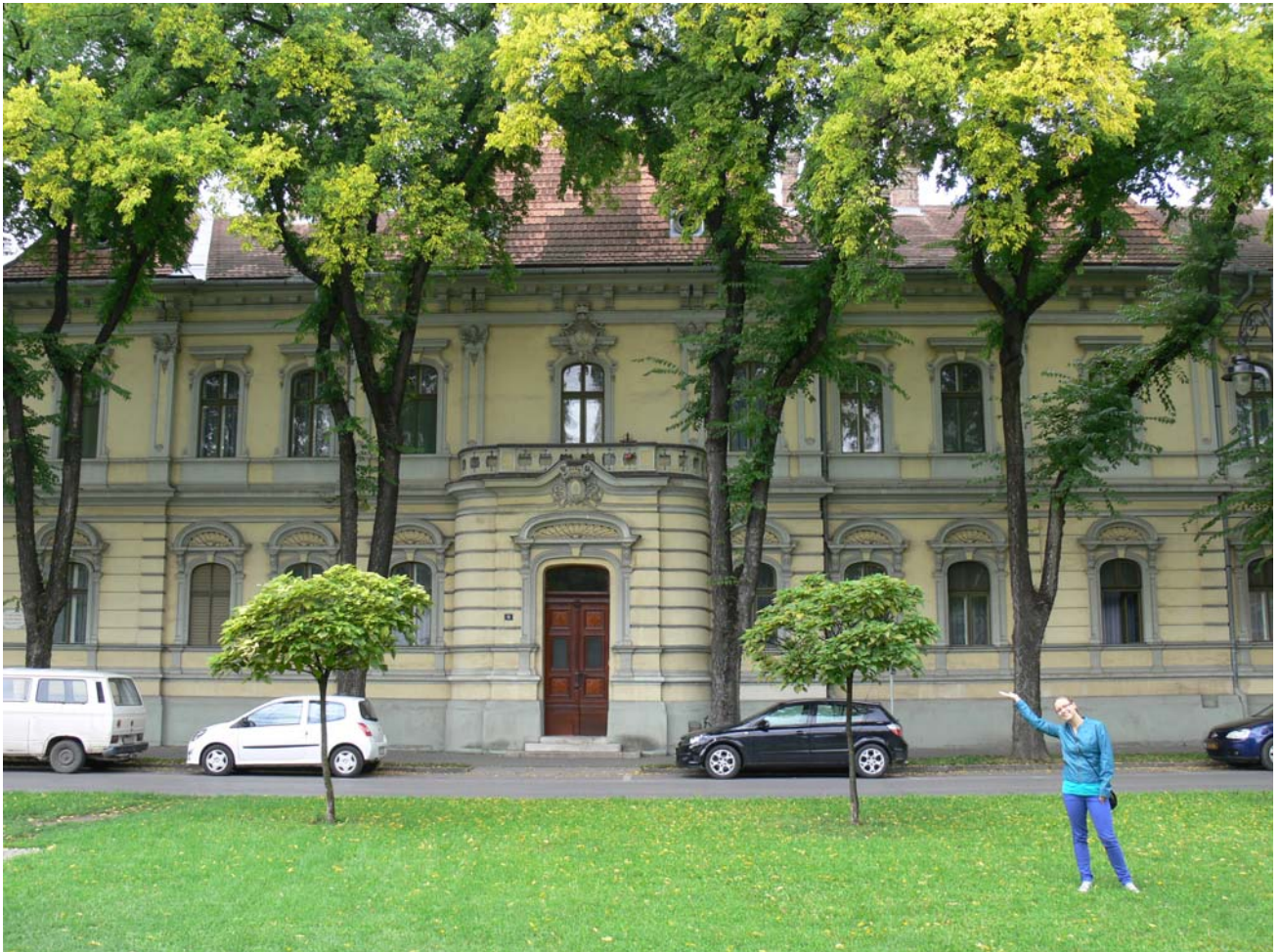
Szabadka, Püspöki Palota