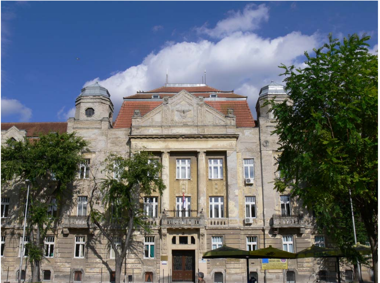
Szabadka, Ivan Sarić Iskola