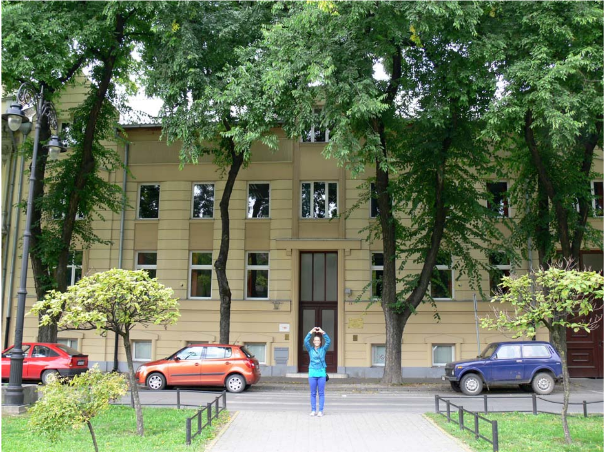
Szabadka, Kosztolányi Dezső Tehetséggondozó Gimnázium