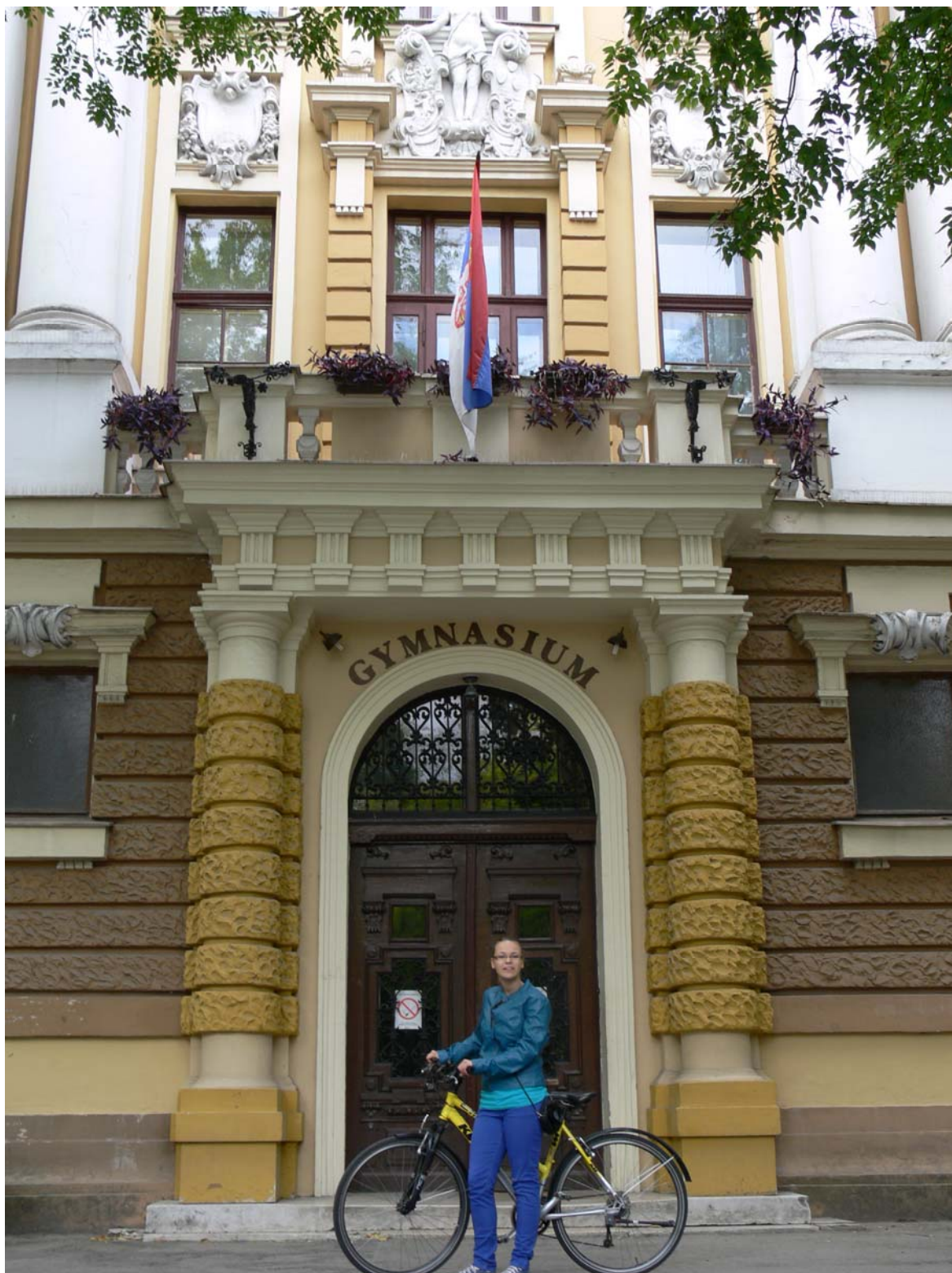
Szabadka, Svetozar Marković Gimnázium