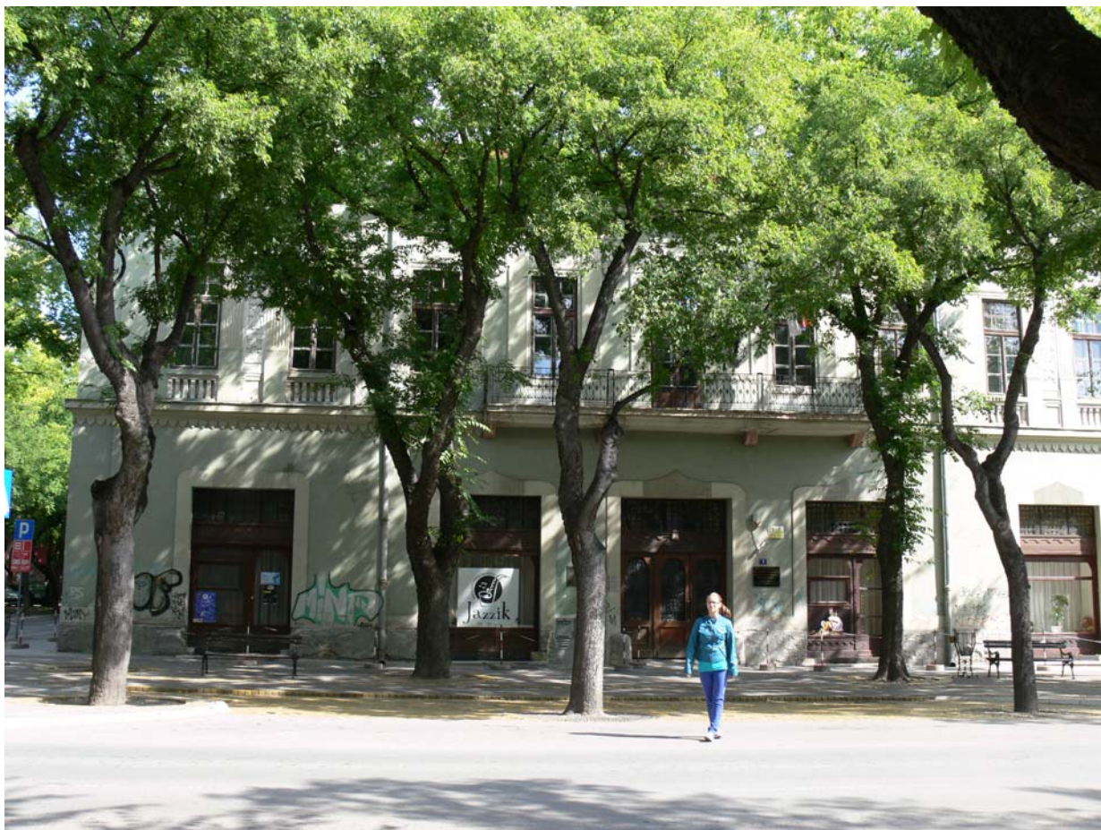
Szabadka, Magyar Imre bérpalotája, mai Zenede