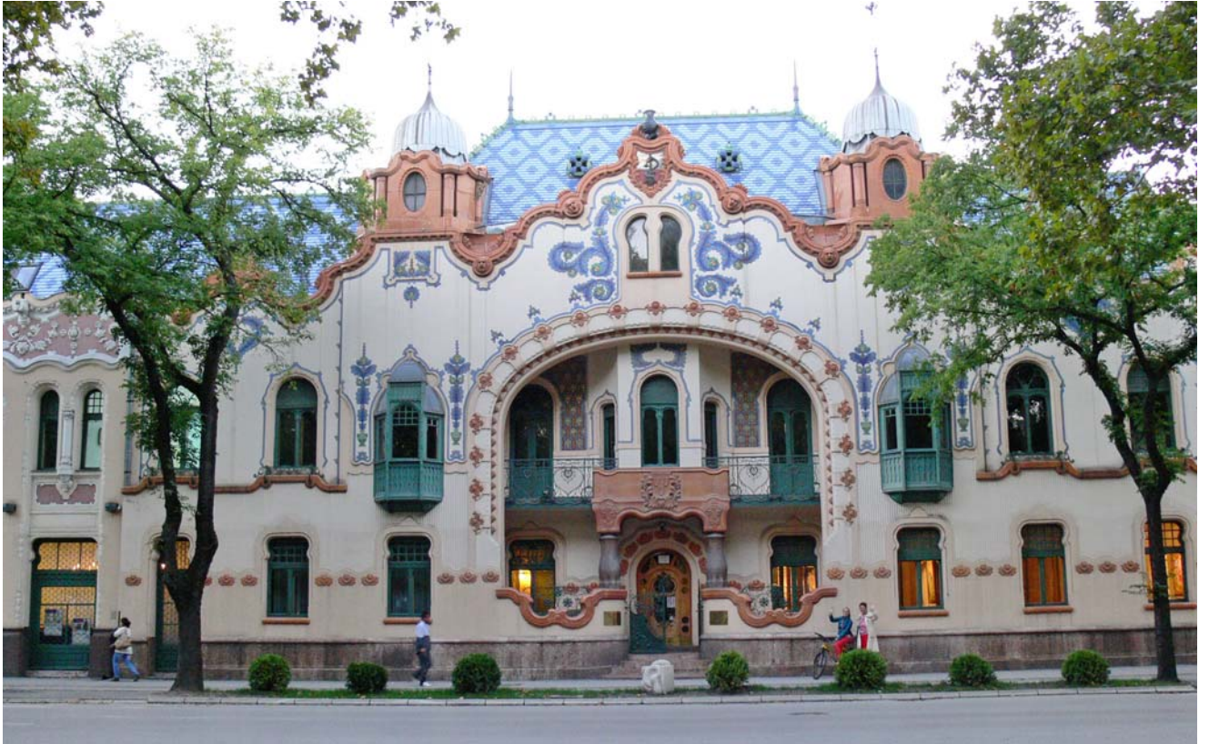
Szabadka, Raichle Ferenc Palota