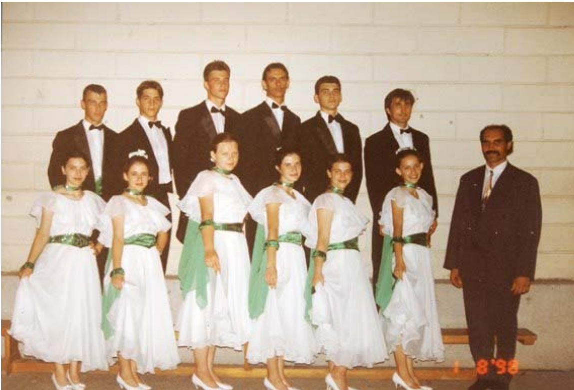
(A kép 1998-ban készült egy fellépésen ahol egy standard táncot mutattak be)