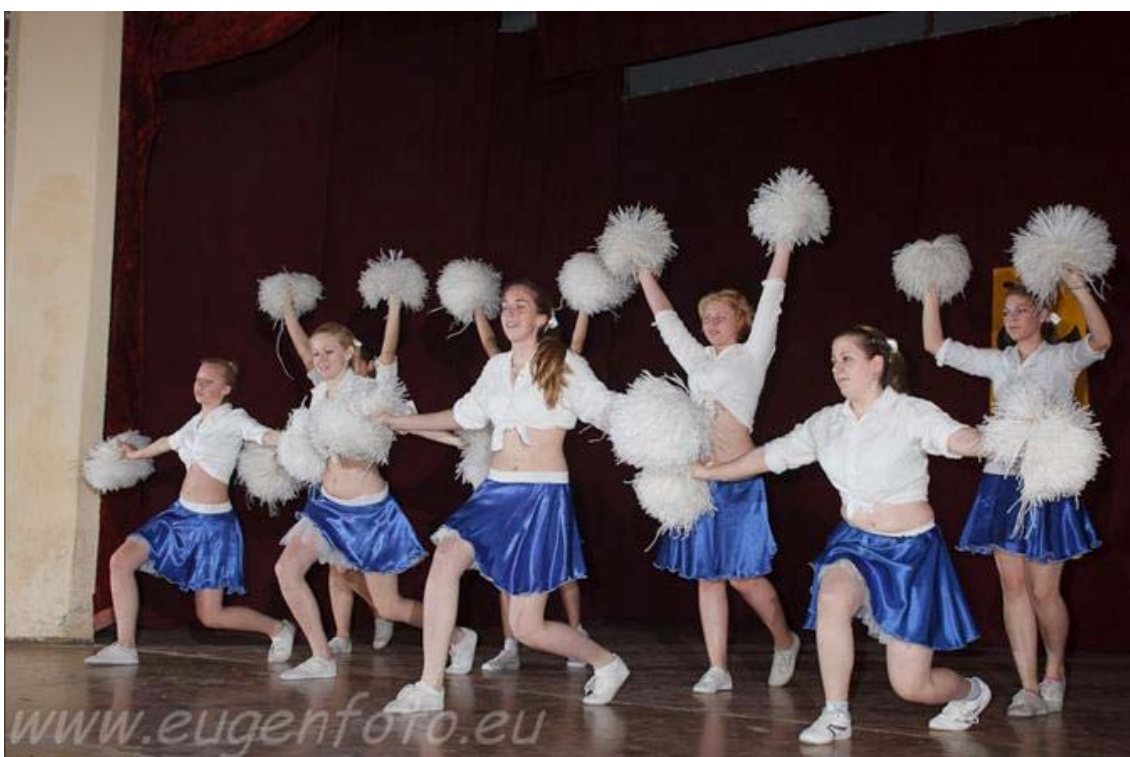
(A Zentai lányok Pom-Pom koreográfiája)

Azonban a táncegyüttesnek még ma is vannak olyan tagjai, akik az egyetemi tanulmányaik mellett, ha idejük engedi elmennek egy-egy próbára, sőt néha még a fellépéseken is találkozhatunk velük.