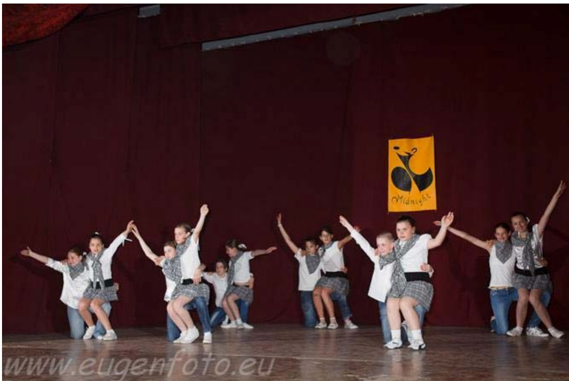
(A legfiatalabb csoport country produkciójának bemutatása látható ezen a képen)

Azonban a táncegyüttesnek még ma is vannak olyan tagjai, akik az egyetemi tanulmányaik mellett, ha idejük engedi elmennek egy-egy próbára, sőt néha még a fellépéseken is találkozhatunk velük.