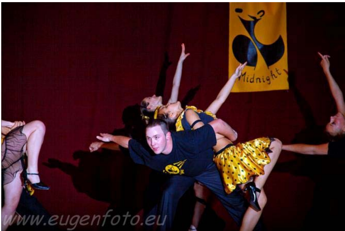
(A képen egy mambó formáció látható, amit a Midnight zentai tánccsoportja ad elő)

A sok-sok gyakorlás után is előfordul, hogy a fellépéseken nem minden tökéletes. Vajon melyek a legemlékezetesebb esetek a fellépéseken?