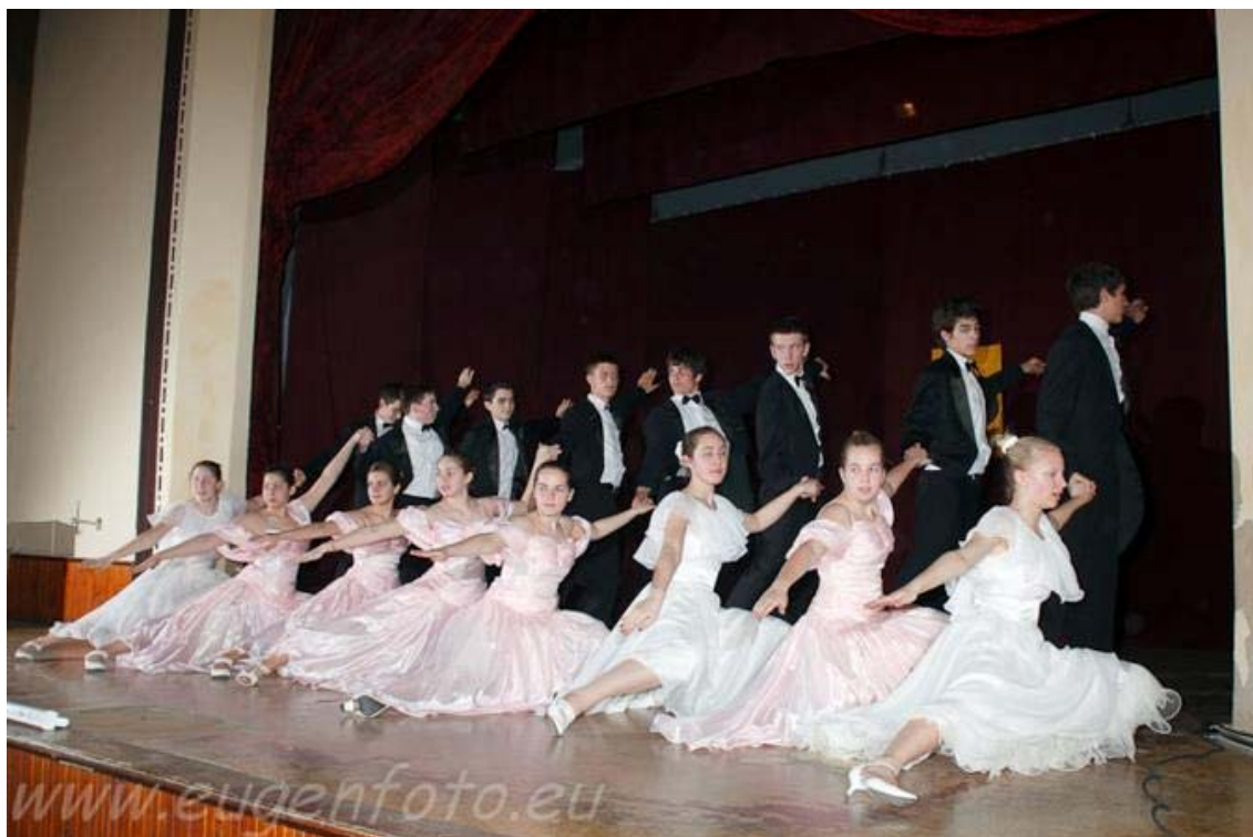
(A képen egy bécsi keringő koreográfia látható)