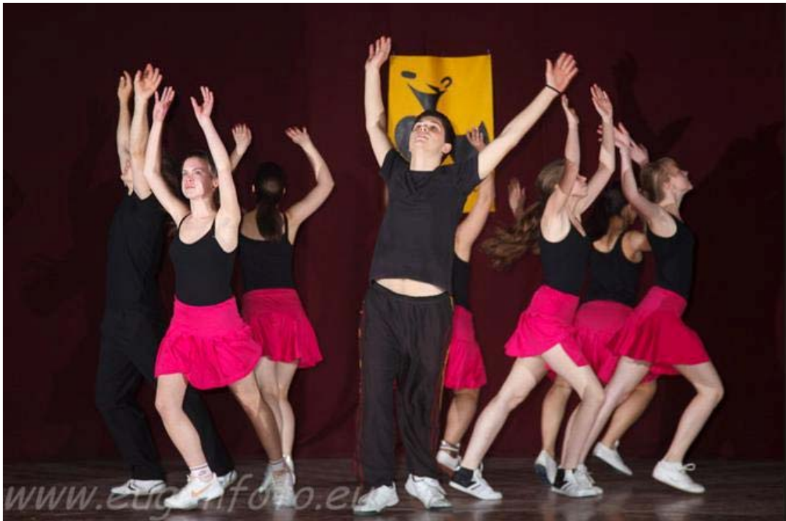
(A képen az egyesület Csókai csoportja látható)