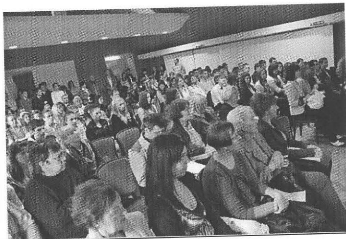
II. kép: Az idei genius konferencia résztvevői és felkészítő tanárai

A diákkonferencia egyik nagy előnye (talán ezért is olyan kedvelt a fiatalok körében), hogy a fiatalok élményeiket és tapasztalataikat, sok más országos szintű versennyel ellentétben, magyar nyelven oszthatják meg egymással. Az első Genius diákkonferenciát 2003-ban szervezték meg az újvidéki Svetozar Markovic gimnáziumban, amely azóta is minden